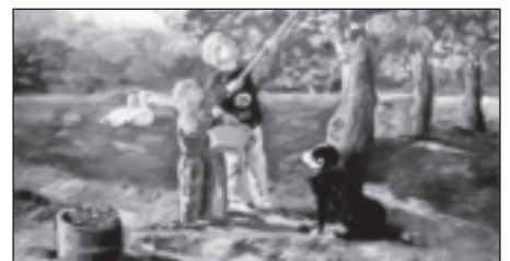
Aan een boom zo volgeladen...

Nieuwsgierig geworden? Kom gerust kijken. U bent van harte welkom tijdens de openingsuren van De Schakel, maandag van 13.00 tot 17.00 uur en op dinsdag t/m zaterdag van 10.00 tot 17.00 uur.